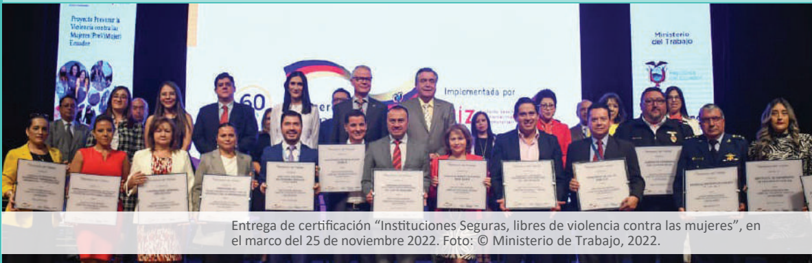
Entrega de certificación “Instituciones Seguras, libres de violencia contra las mujeres”, en el marco del 25 de noviembre 2022.