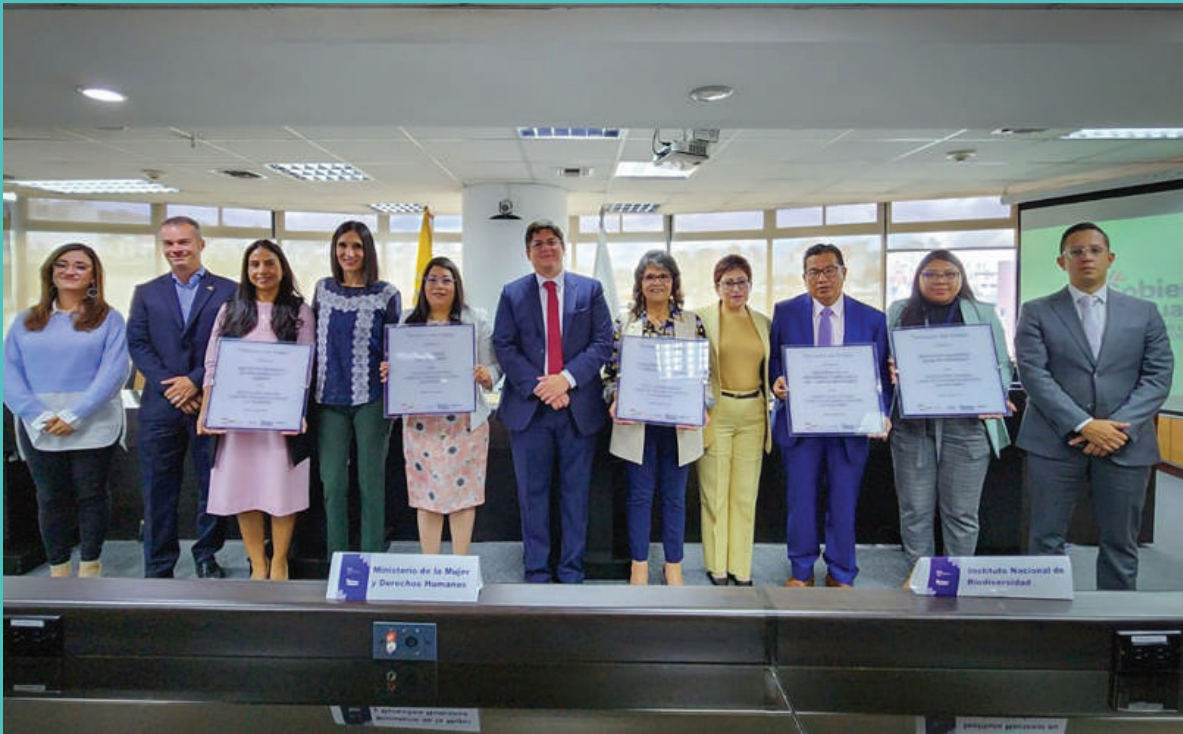
Entrega de certificación “Instituciones Seguras, libres de violencia contra las mujeres” en el marco del 8 de marzo de 2023.